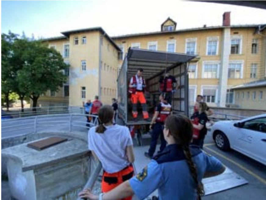
Priprava za transport nepokretne osebe

Polje 5A, 1217 Vodice, e-mail: prvapomoc@gzvodice.org , www.pp.gzvodice.org