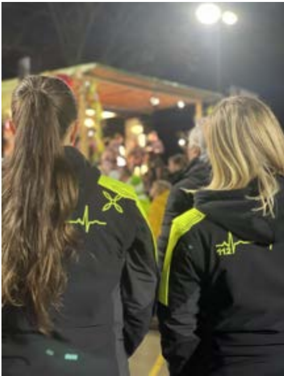
Dežurstvo na prireditvi

Enota ima svoja sredstva zagotovljena s strani občine Vodice in s strani Gasilske zveze Vodice. Oprema in usposabljanja so za nas velik finančni zalogaj, zato imamo še naprej omogočeno ključno besedo EPP5, preko številke 1919, s katero posameznik lahko enoti daruje 5 €. Zelo pomemben del financiranja so tudi podjetja in posamezniki, ki z lastnimi prispevki enoti omogočajo, da se člani enote lahko dodatno usposabljamemo in nakupujemo potrebno opremo.