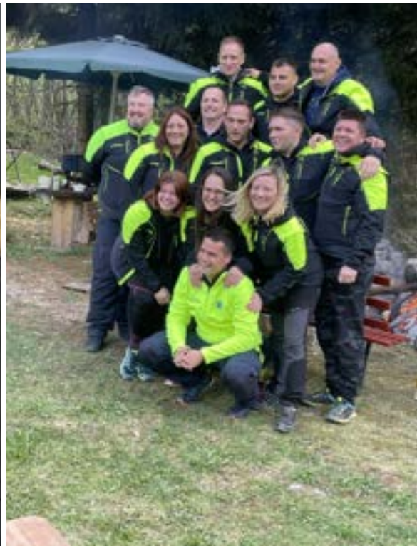
Del enote na "teambuildingu"