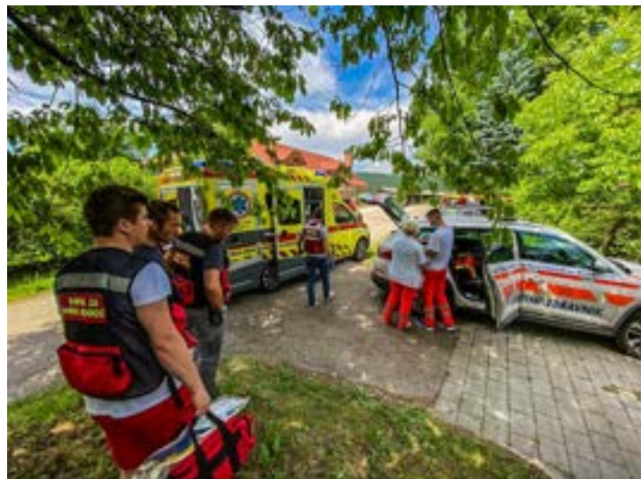
Člani enote na intervenciji

Člani enote smo aktivirani na predlog dispečerske službe zdravstva (DSZ) preko regijskega centra za obveščanje (ReCO) na vsa nujna stanja rdeče prioritete po Slovenskem indeksu za nujno medicinsko pomoč. Torej na vsa stanja, kjer je ogroženo življenje oz. na stanja, kjer zdravstveni dispečer presodi, da bi naše posredovanje izboljšalo končni izid za poškodovance oz. nenadno obolele. Pomembno je poudariti odlično sodelovanje z zdravstvenimi dispečerji, katere imamo na voljo ves čas posredovanj in so zelo pomemben del na vsaki intervenciji! Sodelovanje DCZ Ljubljana z našo enoto je lep primer dobre prakse!