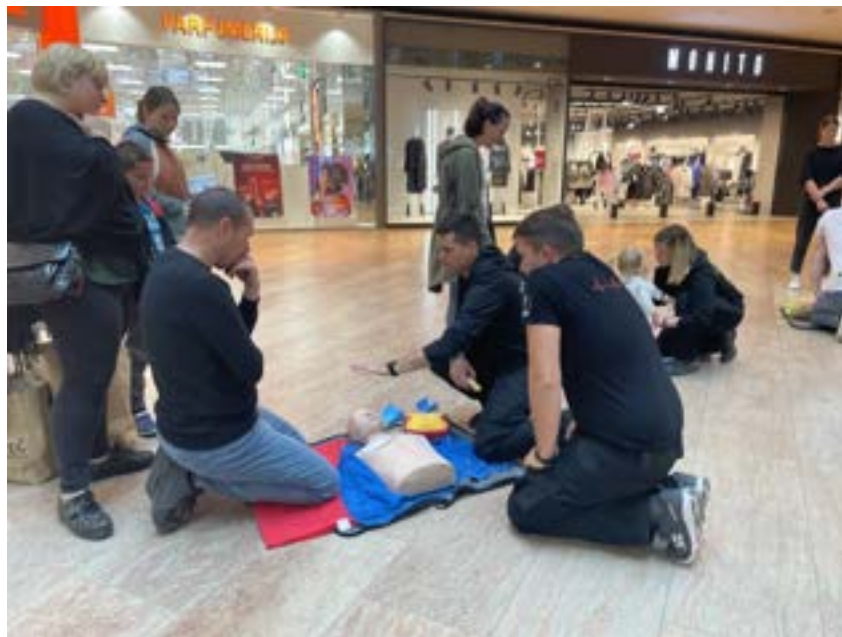
Delavnica TPO v nakupovalnem središču

V letu 2022 smo izvedli več izobraževanj iz osnov prve pomoči za laike. Temeljne postopke oživljanja smo prikazovali v podjetjih, pri prijateljih, na raznih dogodkih. Sodelovali smo pri dnevu odprtih vrat PGD Polje, dežurali smo na različnih športnih dogodkih, veselicah in občinskih prireditvah. Kot sogovornike so nas povabili na različne intervjuje v tiskane medije, ob svetovnem dnevu oživljanja smo kot primer dobre prakse spodbudo o udejstvovanju pri prvi pomoči v svet poslali na valovih radia Val 202.