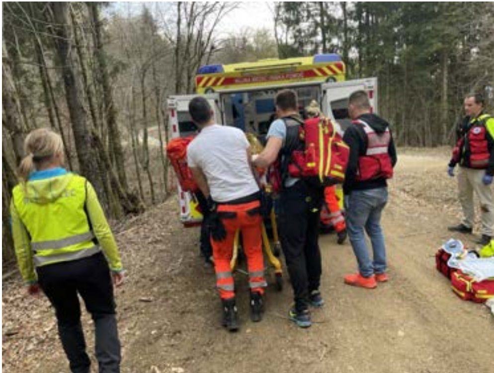
Delo na intervenciji

Nabor vrst intervencij je relativno širok. Zaradi lažje preglednosti sem določene intervencije združil v eno izmed kategorij. Vseeno pa velja, da niti dve intervenciji nista enaki. Morda letos posebej izstopajo alergijske reakcije, katerih je bilo predvsem poleti veliko. Izstopa tudi organizacija in izvedba transporta ter prenosa osebe, katero smo uspešno zaključili s pomočjo enot nujne medicinske pomoči, policije, gorskih reševalcev in s pomočjo težke gradbene mehanizacije.