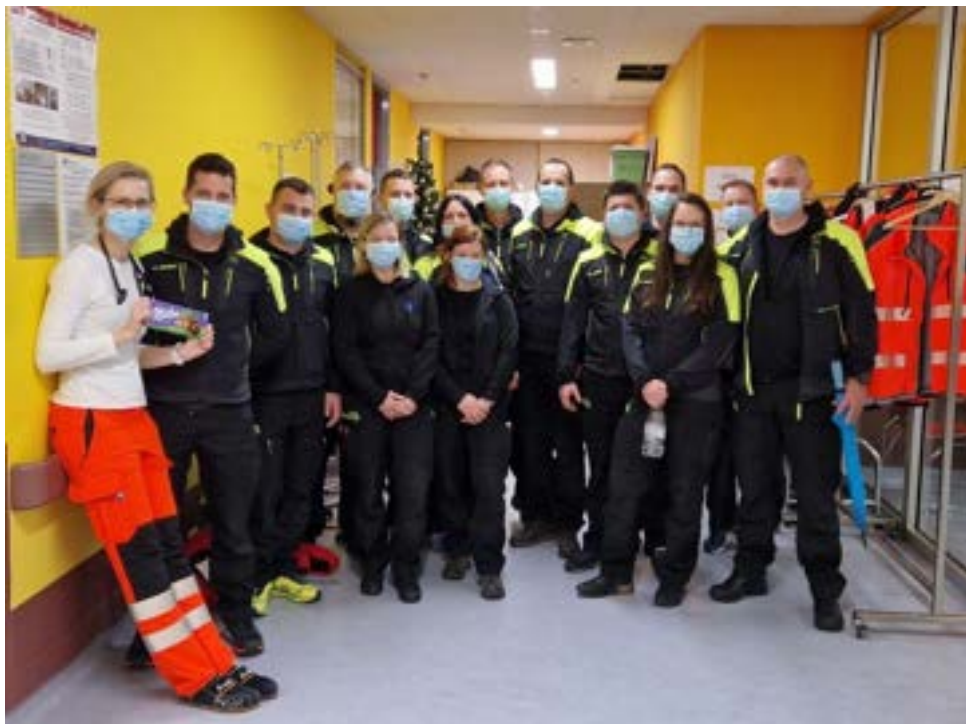
Obisk urgence v Ljubljani

Kot poveljnik enote sem izredno vesel, da je odziv članov na intervencije, vaje, usposabljanja in navsezadnje tudi družabne dogodke znotraj delovanja EPP na izjemno visokem nivoju. Ekipa, s katero imam priložnost sodelovati, je izjemna in to dokazuje iz leta v leto. Povezovanje lokalne skupnosti, gasilcev in strokovnjakov s področja urgentne medicine nam zagotavlja primerne pogoje za delo in omogoča, da posredujemo varno in učinkovito.